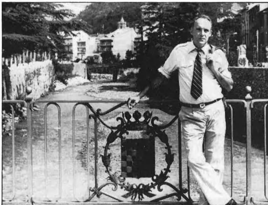
«El periodisme escrit ens és imprescindible»

plicació, eixugant-se braços i mans, els únics membres afectats pel doll d'aigua, insolent però fugaç.