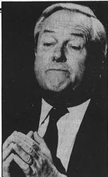
Jean-Marie Le Pen, de torturador a diputat

soldre Fuerza Nueva per fer una futura recomposició des de l'ombra, amb una major mobilitat , Jean-Marie Le Pen ocupa el seu lloc d'honor en la ultradreta francesa i és el cap indiscutit dels p-n o repatriats .