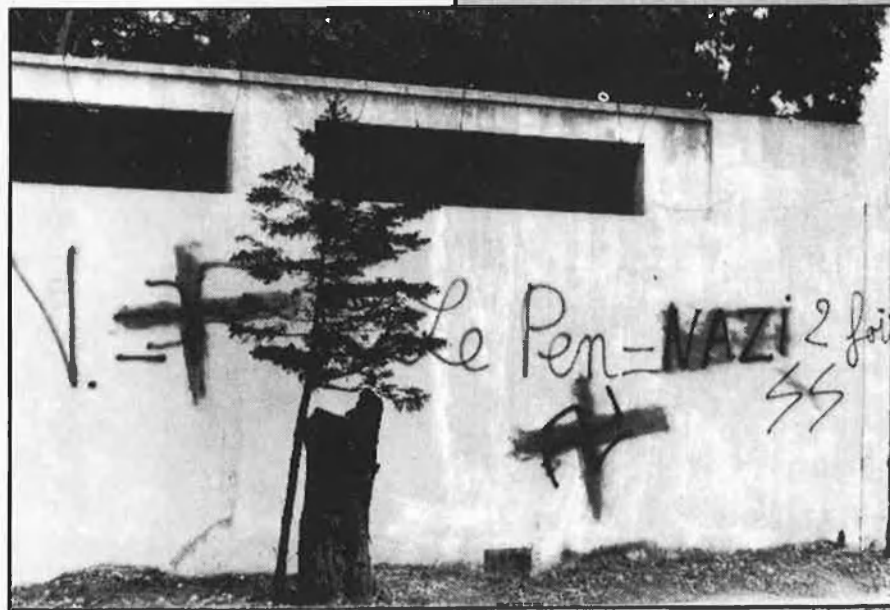
Simplement, un nazi

Aquest home, que ha substituït el vell pedaç negre amb què ocultava el buit del seu globus ocular, perdut en una estranya brega, per un ull de vidre, exposa la base de la seua filosofia política en el llibre Els francesos en primer lloc , on parlant del nazisme, diu: «el nacionalsocialisme que, fins ara, no ha estat jutjat més que pels seus vencedors, serà finalment jutjat per la història».