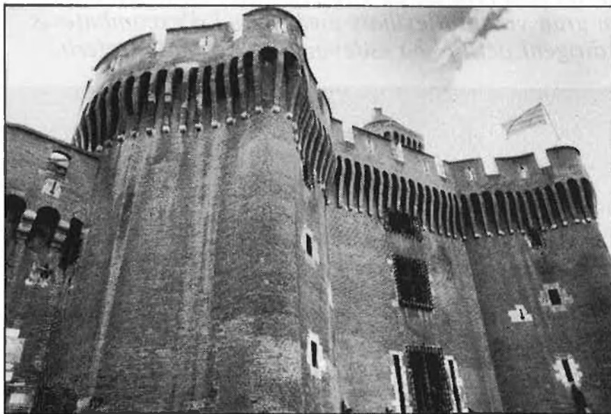
Perpinyà: massa vots per al feixisme

Jean Marie Le Pen, el camarada de Blas Pinar, Giorgio Almirante, els