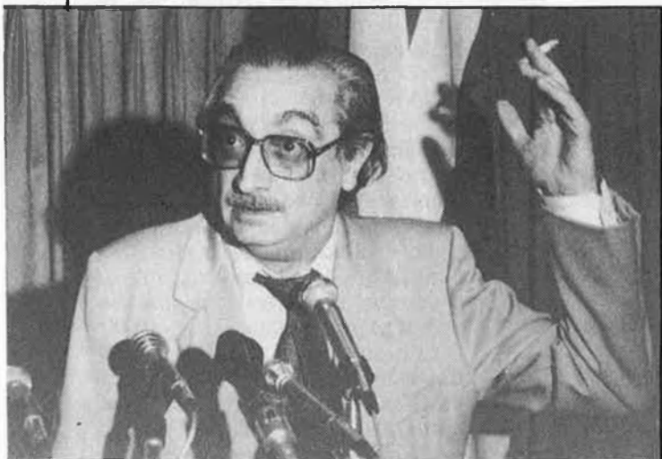
Fuster, el compromís amb la investigació i l'assaig moral / Jordi Vicent

I deu anys més tard escrivia: «no feu cas de les lleis. Bé: feu-ne cas, per evitar mals majors». Si és que són evitables.