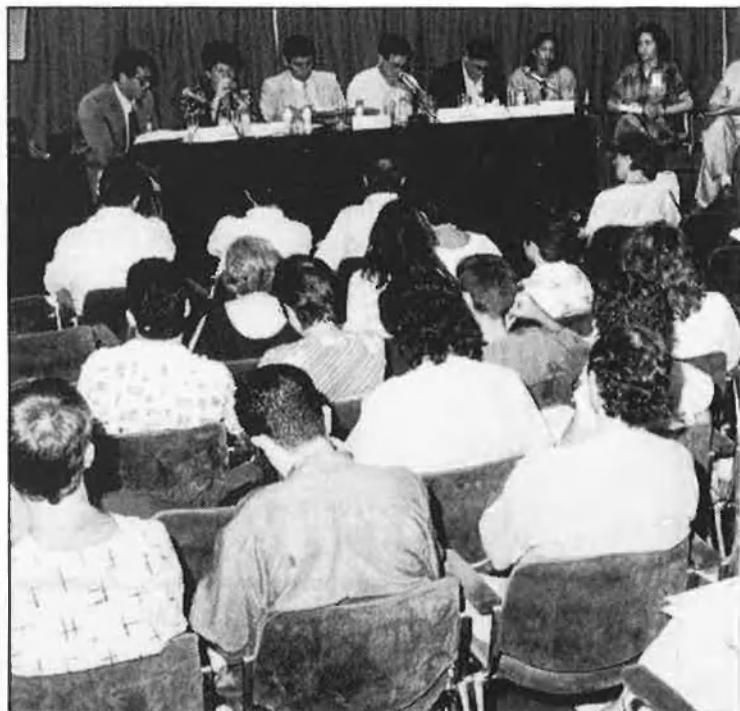
Taula redona sobre la problemàtica de la indústria valenciana de la moda

La preocupació central per la competitivitat i la reflexió sobre el context cultural, l'estètica i la funcionalitat, són els pols que han marcat, d'alguna manera, les intervencions de l'encontre. En les definicions suggerides des de cada ponència han resultat perfectament detectables les matisacions i les diverses formes d'entendre el paper del disseny.