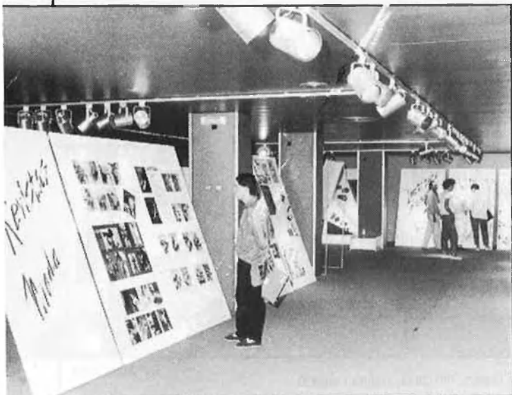
Un aspecte de l'exposició «Moda i comunicació»