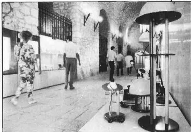
El disseny industrial, cultura i creació