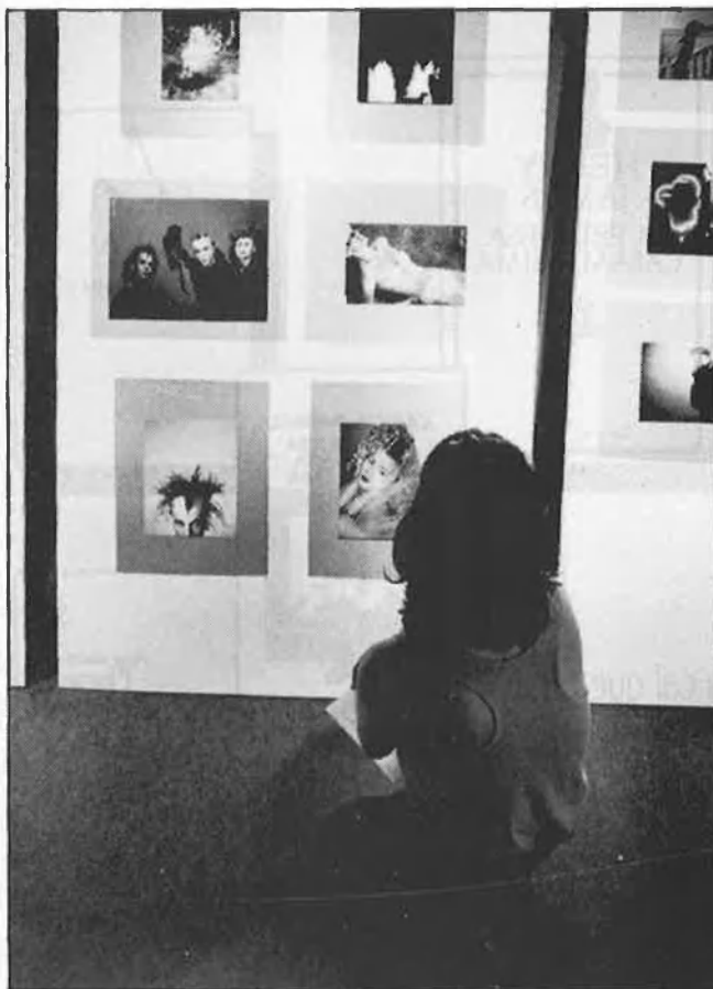
La premsa, un espill de la moda i el disseny