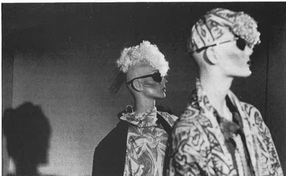
Moda i disseny, un bon binomi