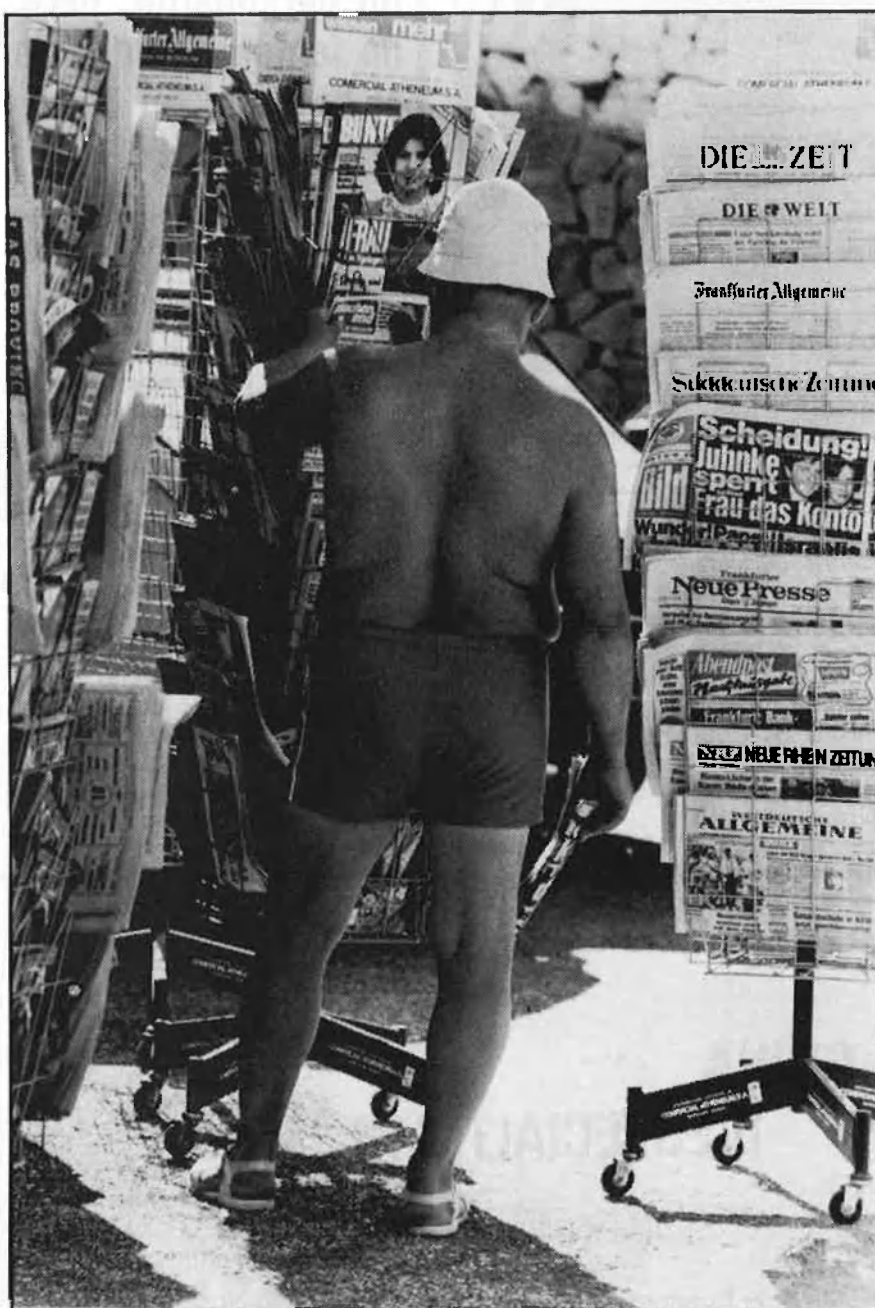
El potent turisme forani envaeix les platges