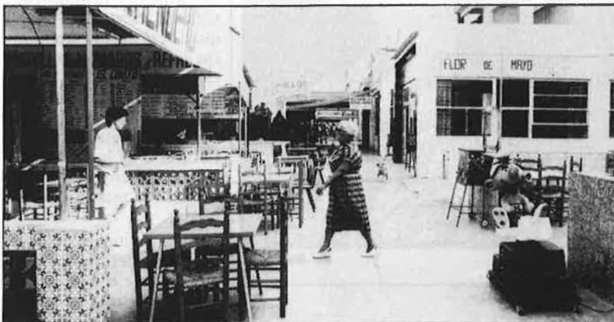
Els «xiringuitos» de les Arenes

Per últim, destaca el més recent dels locals de la platja: Duna, una espècie de tenda del desert, muntada a base de llençols blancs, que s'inflen quan bufa el ponent i que deixa passar l'aire a la manera d'un ventilador atmosfèric.