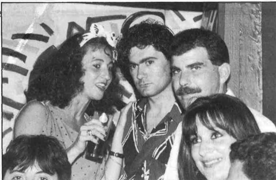
La «gulerestre», el pintor i l'escultor

Però és en les nits d'estiu, quan els televisors s'apaguen i els neons bri-