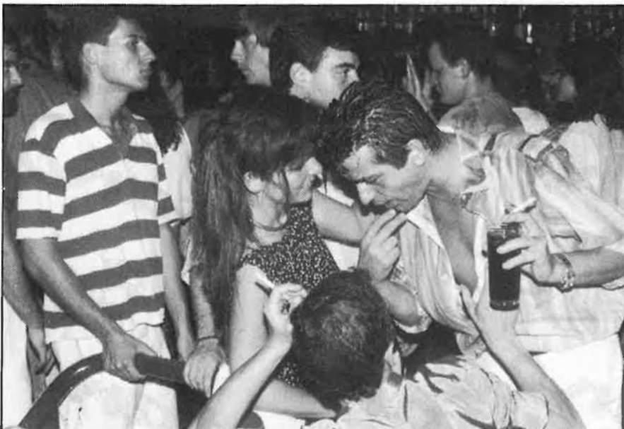
«Marxa on the rocks»

Una altra solució, una mica més fenícia, és deixar-se caure en els