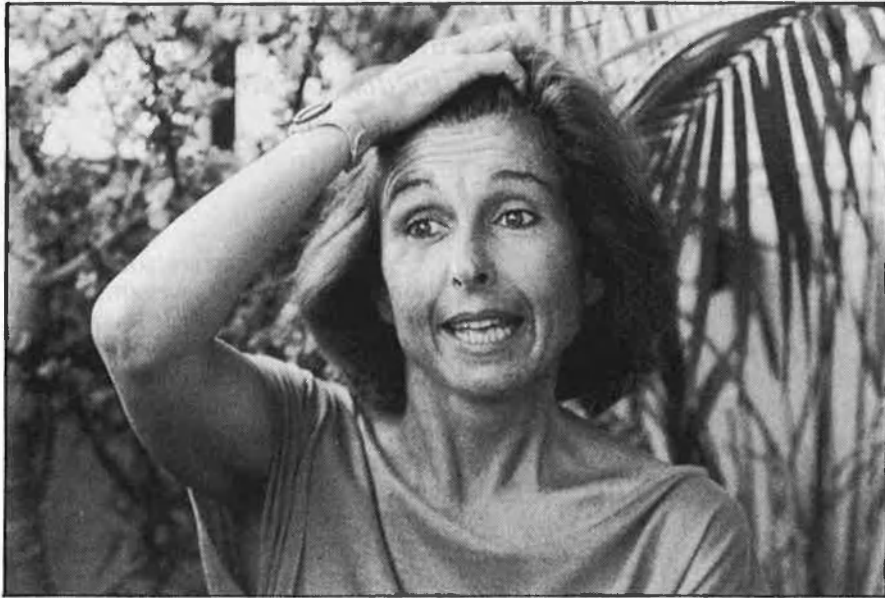
Però en teatre, fins que no arriba...