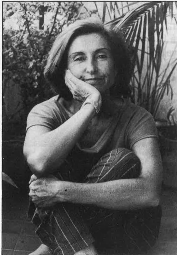
El relaxament d'un èxit merescut

rò la cosa és més general. El teatre encara és en un moment de crisi. També, s'havia perdut un públic, un públic que, a més, no s'interessa pel teatre com a cultura ( Senyor, quanta raó tens ) i que hi anava només per veure les coses més comercials. Això ha fet que ací ens trobem encara en la prehistòria de la història. A Barcelona, encara que s'ha patit la mateixa crisi, el mateix problema, perquè, total, fa deu anys que funciona, ara tenen un públic molt ampli. Hi ha gent jove, estudiants, una burgesia que acudeix al teatre a veure un clàs-