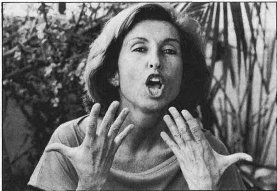
Hi ha tons i gests, intranscrivibles

—Home, no ho sé, M'imagino que el que Casimiro deu voler és recuperar un públic i que està portant muntatges que puguen cridar l'atenció, del públic que pot anar al Principal, la burgesia, supose. Vol recuperar aquest públic amb grans espectacles. Trobe que està bé. No m'hi fique, perquè em pense que és difícil. Al Principal hi ha hagut programacions que estaven molt bé, però aquest públic no hi ha anat. Trobe que Casimiro està tirant carnatge; a mi em fa