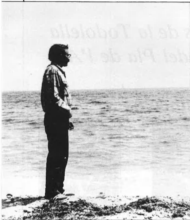
Després de tretze anys, la llibertat

La primera gran fuga del Movimiento va ser a l'agost del 1971, quan cent