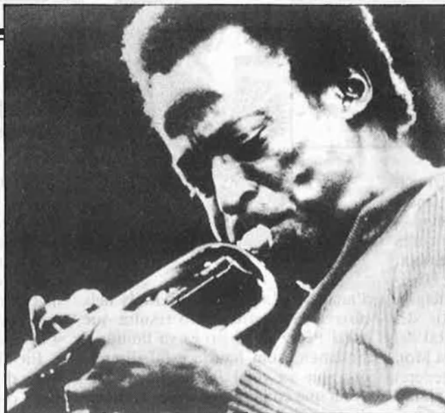
Un dels grans creadors de jazz

nou quintet amb joves músics molt dotats: el saxo tenor George Coleman, aviat substituït per Wayne Shorter, el pianista Herbie Hancock, el contrabaix Ron Carter i el jove bateria de 19 anys Tony Williams. El free jazz ha aparegut i, malgrat que Miles pretén de quedar-ne al marge, no pot romandre insensible davant les transformacions del jazz. A les actuacions continua interpretant el repertori habitual, amb una frescor i una llibertat absolutament noves. A les gra-