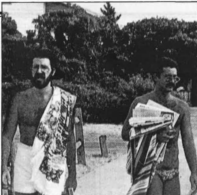
Hi predomina el «look macho»

Els clubs gais tenen tots en comú el gust pel manierisme decoratiu, el pastitx mitològic, el rococó passat