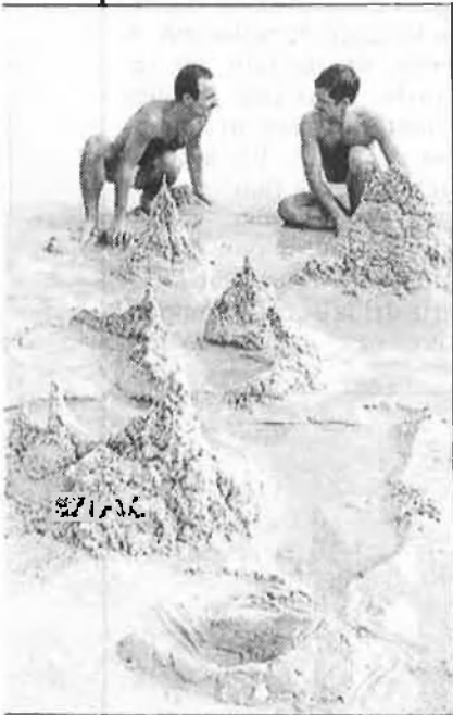
Sexe i platja

En una època en què per als estaments més reaccionaris la comunitat gai s'ha convertit en una espècie de «porta de l'infern» i es parla de «malediccions bíbliques», la temporada estival obri un parèntesi refrescant, on la trilogia «sexe, platja i discomúsica» compon l'agenda principal del turista gai (o no gai), enmig d'un paisatge prefabricat, turisticat. La parella heterosexual de turistes escocesos «viuen» la seua «Noche Espanola» amb sagnia i flamenco-sevillanes a manta, mentre la parella homo «viuran»