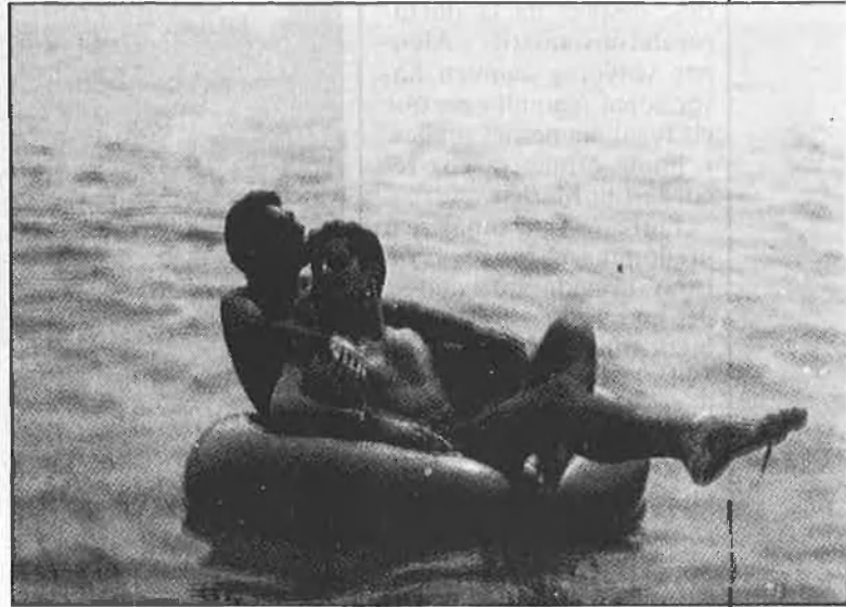
«La porta de l'infern»

Quan la tortura solar dona descans al dia i la nit comença a moure's, els carrers de Sitges es transformen en una Babel de pret-a-porter , teatre de va-