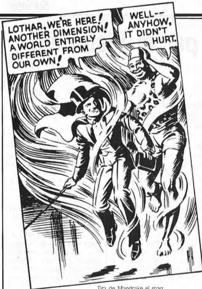
Tira de Mandrake el mag

ha entre un il·lustrador i un historietista? Per exemple, entre Ana Juan i Daniel Torres.