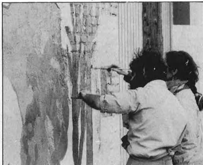
X Escola: ampliació de les activitats extradocents

De 1980 al 1982 haurien de suportar, a més, les ambigüitats del Consell d'UCD, quan no les escames declarades d'Amparo Cabanes, consellera de Cultura. La crítica a l'inoportant Decret de Bilingüisme i a l'Estatut de Centres definiria l'actitud de l'Escola d'Estiu en aquests anys confusos. Al mateix temps, les escoles s'estenien a les comarques, seguint el model català. Pri-