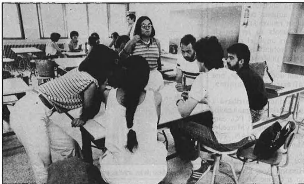
Un espai de reflexió