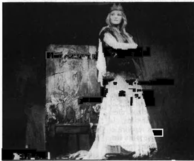
Bolek Polivka: una sàtira a doble banda

cintes adequats, s'ha ampliat la xarxa de contactes, etc. El resultat, sobre el paper, és una programació sorprenent, densa, fins i tot excessiva. Es fa difícil destacar propostes dins d'aquest conjunt, i més quan la majoria són, a València, completament inèdites. En teatre, cal reco-