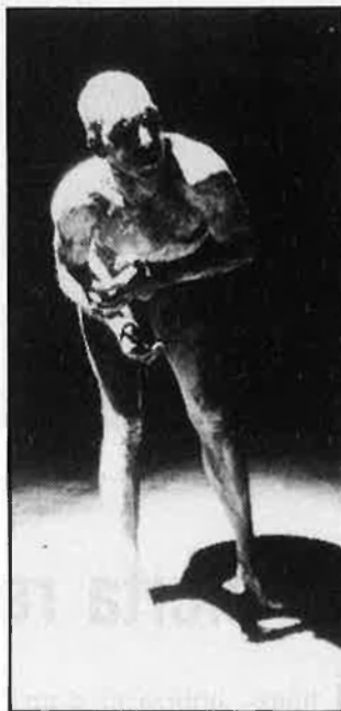
/ Jordi Vicent

Aquests mateixos dies, al mercat d'Abastos, la Fura dels Baus repetirà el seu Accions , que tanta sensació causà l'any passat. Ara, almenys, el qui hi vaja ja sap més o menys el que l'espera.