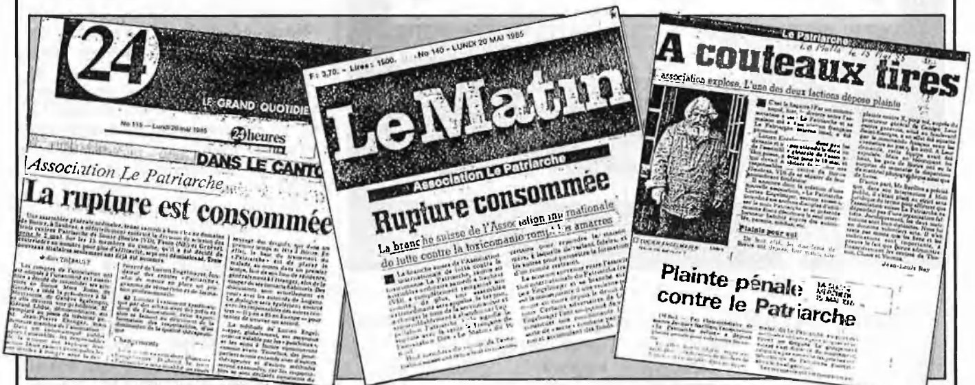
Tota la premsa helvètica ha seguit l'escàndol

Però allò que segurament no li permetrien contar és la seua vertadera tragèdia personal, ja que «P» ha-