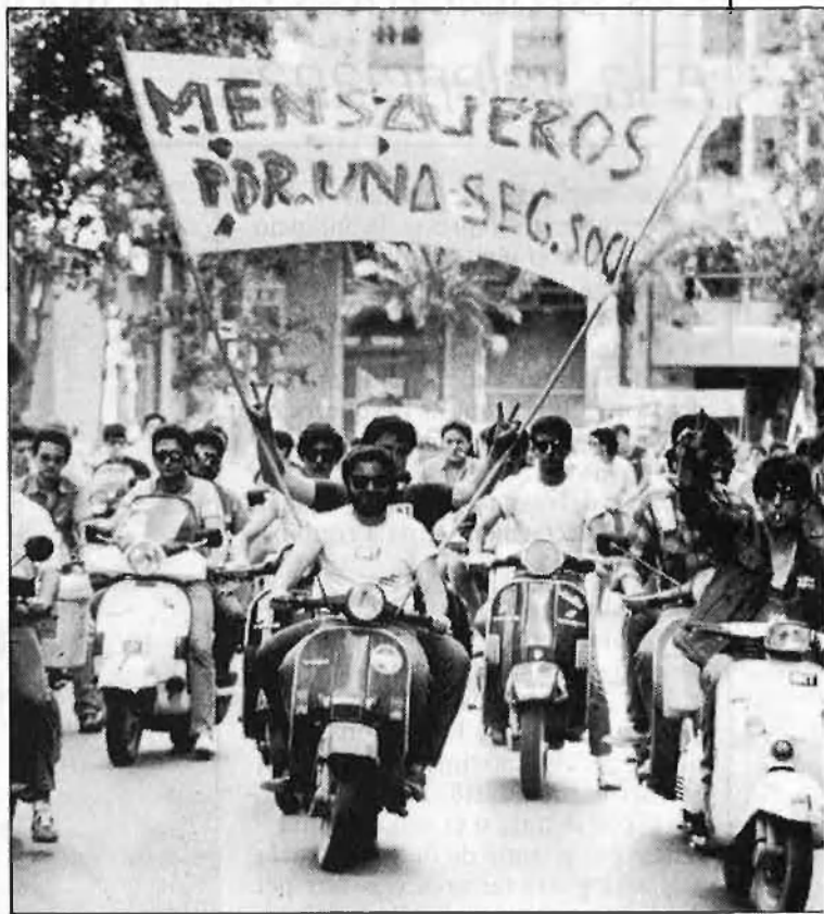
Un nodrit grup de «missatgers» encapçalà la manifestació a València

A la vesprada, unes deu mil persones a València i