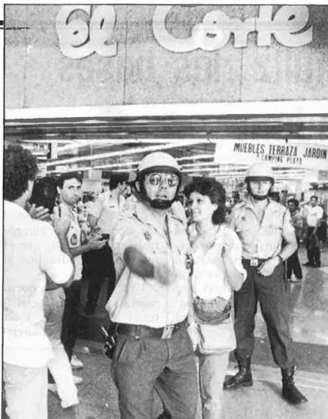
La presència de la policia provocà tensions amb els piquets

Els incidents més greus es varen produir en la manifestació de la vesprada a la Plaça de Catalunya, en la qual participaren unes cinquanta mil persones, quan diversos manifes-