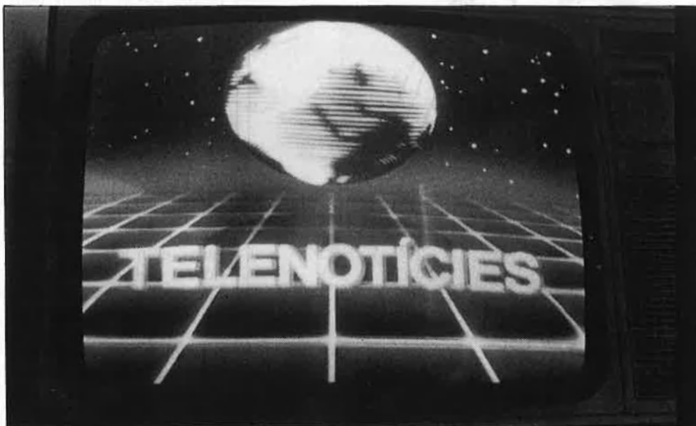
Tot es redueix a millorar-ne la imatge