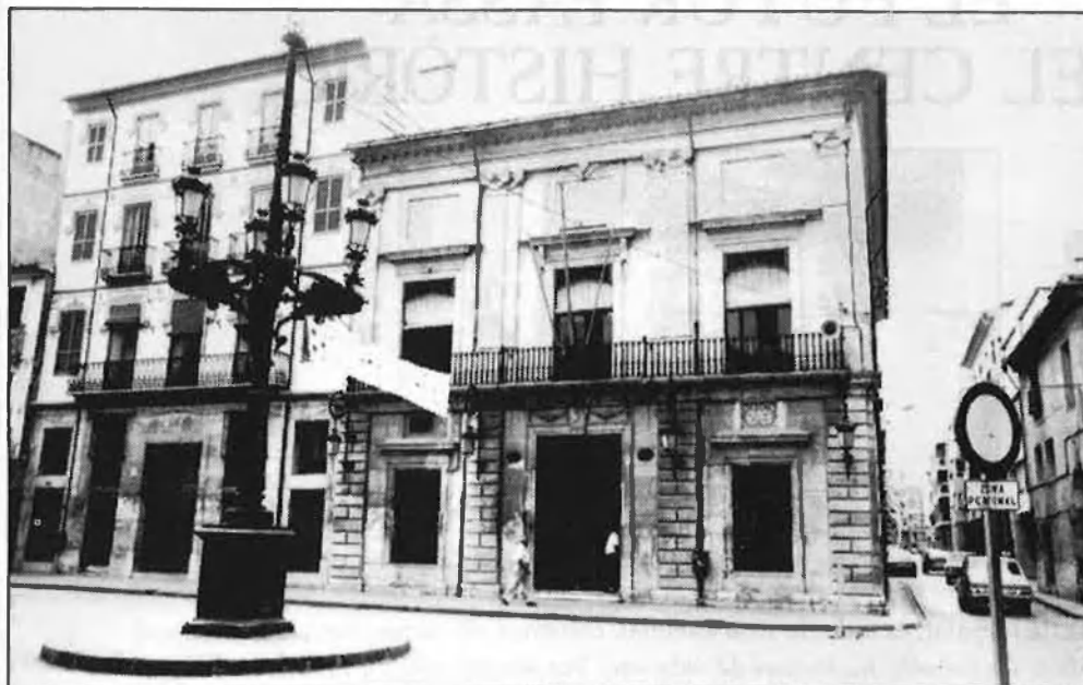
Sueca, el centre de la primera batalla

En tot cas, el delegat del govern —i el Ministeri de Cultura— han jugat molt fort, potser sense preveure'n conseqüències. I ara, ja es troben immersos en la batalla de Sueca, la guerra de la TV3, al País Valencià.