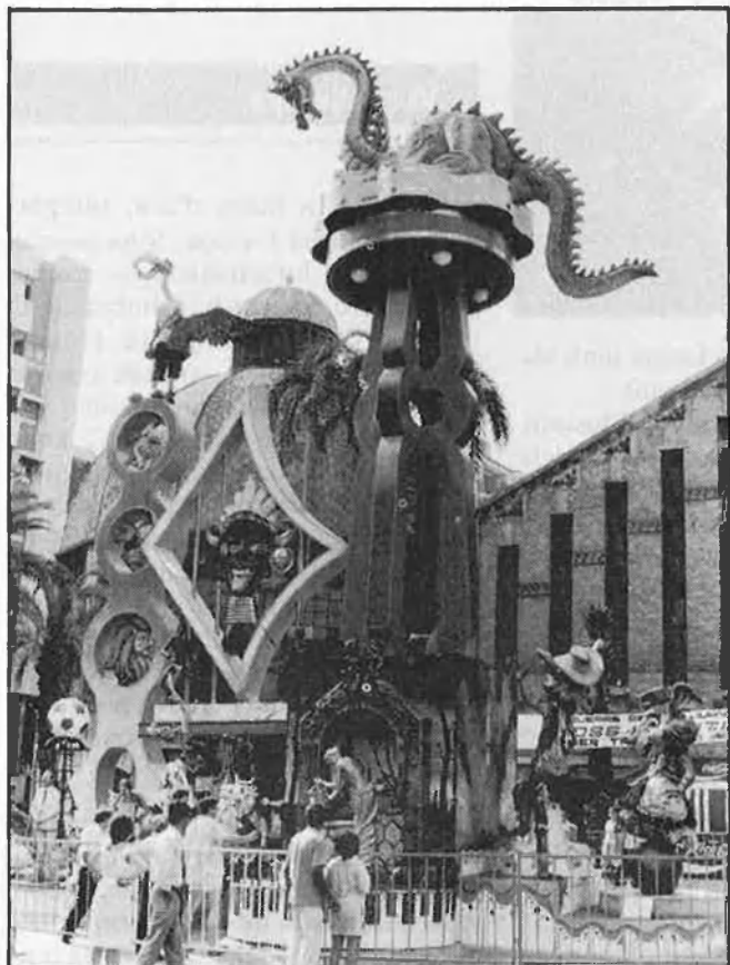
/ Francesc Cutillas

Volen introduir-hi novetats artístiques. En la foto, foguera del Mercat Central (1984)