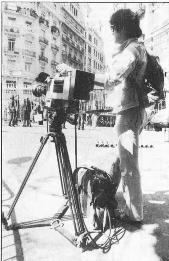
Al juny, les Fogueres

Dins de la comissió gestora les activitats programades són la publicació de la revista de fogueres, que enguany s'edita totalment renovada, i l'organització de la I Marxa Cicloturística, impulsada pels clubs cicloturistes de l'Hospital de l'Insalud i l'empresa Marco Brotons, la gestora, la diputació i l'ajuntament; marxa que passarà per la majoria dels pobles de la província administrativa, amb 250 quilòmetres de recorregut. Hi ha ja dos-cents participants inscrits.