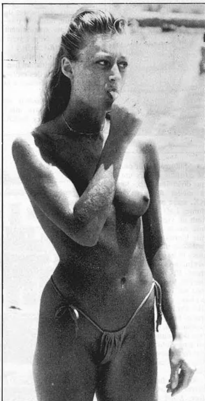
Cossos al sol

L'erotisme és un suggeriment individual, que no té res a veure amb la massificació dels cossos nus. A Mallorca, ara mateix, milers de turistes i d'indígenes prenen el sol o es banyen en pèl o mig despullats. ¿És això una imatge eròtica? Potser l'estètica de molta gent nua no és l'estètica de l'erotisme.