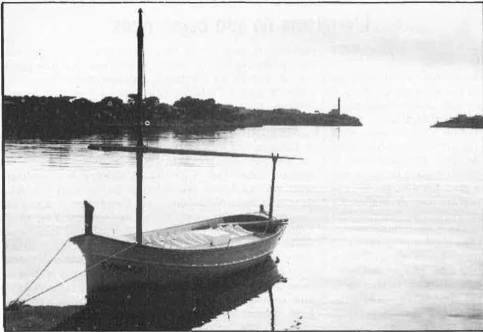
Porto Colom, la calma