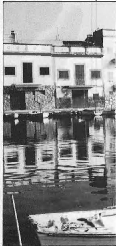
Hi ha una colonització econòmica de l'illa, per

¿Cerquen descobrir de bell nou la nostra mar? No, és molt més senzill,