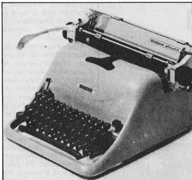
Màquina d'escriure de la marca Olivetti: Lexicon 80, dissenyada per Nizzoli

Per a l'Impiva, «un objectiu prioritari d'aquestencontre és facilitar un diàleg entre el dissenyador i l'home d'empresa, establint un llenguatge més comú entre tots dos».