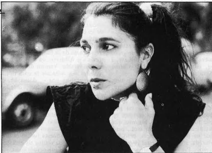
/ Jordi Vicent

Té un rostre greu, sobre el qual és impossible frivolitzar