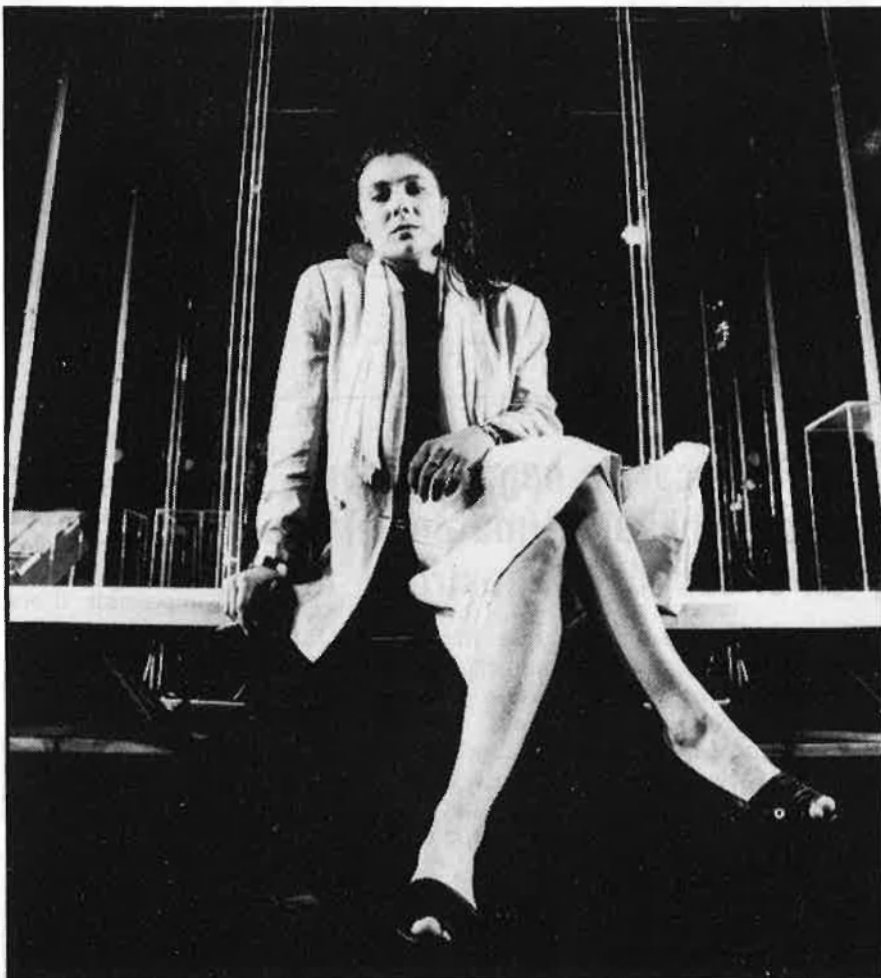
«Boadella aconsegueix el màxim relaxament de la gent»