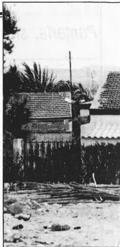
Xalet de la família Molina, a la Pena de les Àguiles.