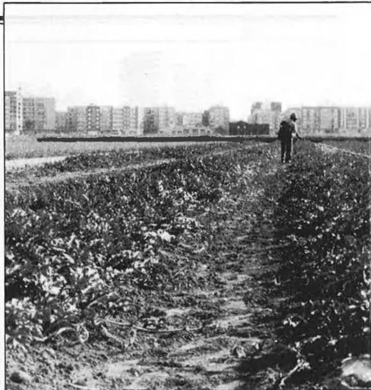
Un país amb una agricultura dinàmica i productiva

És per això que un procés que pot ser molt positiu