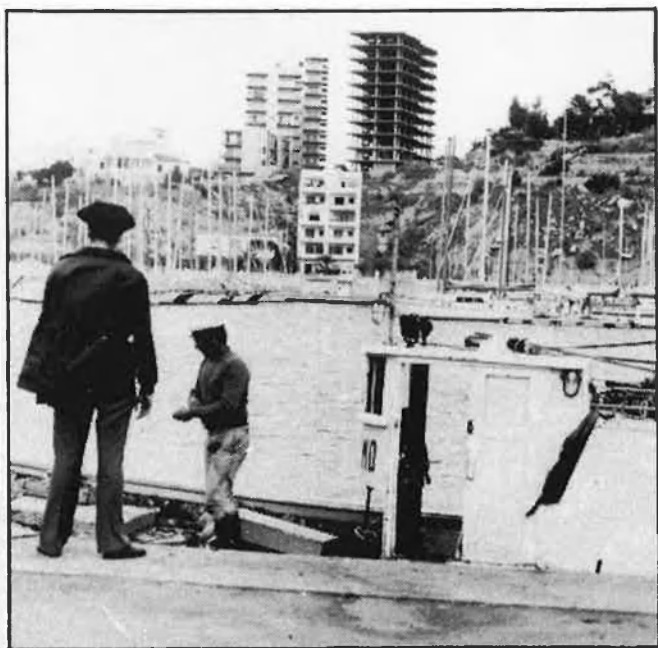
¿Com afectarà la integració els distints sectors econòmics valencians?

Ens troben, tanmateix, enfront d'una CEE que ha travessat un període molt crític en l'estructuració interna, amb les dissensions britàniques respecte a l'aportació al pressupost (saldades finalment amb el compromís de tornar-los una part d'aquesta aportació), i que a hores d'ara s'enfronta al repte de la modernització i la institucionalització definitives.