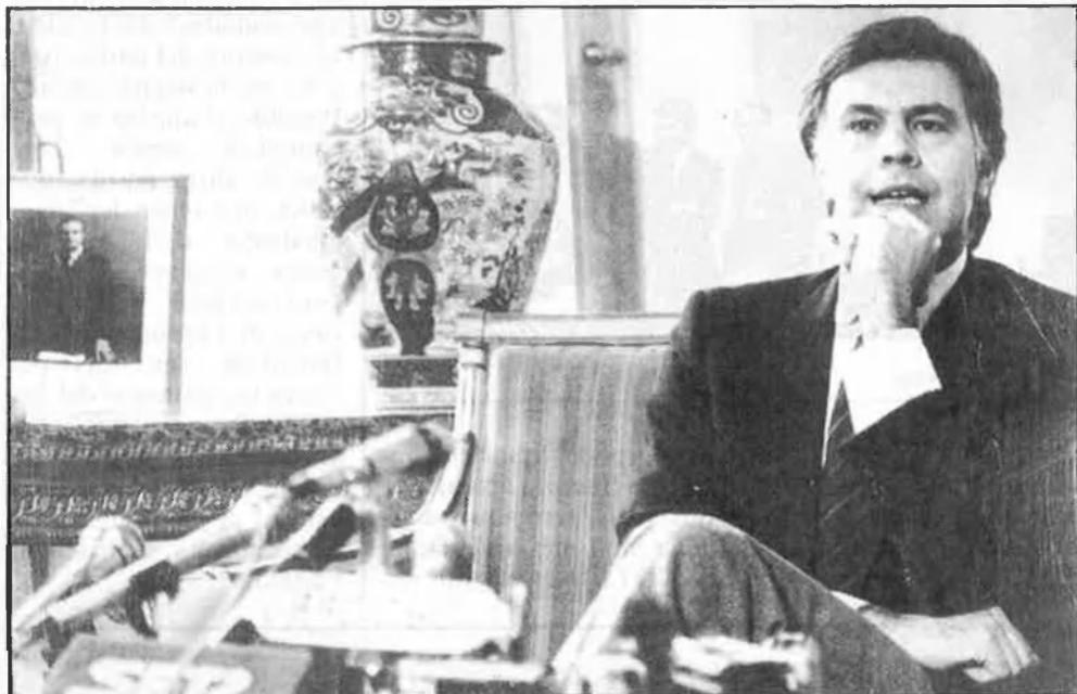
Tots els grups i les ales del PSOE coincideixen en el liderat de Felipe González

qüestions més difícils i, en canvi, es posa tes en aquelles de més raonables, i al capdavall més susceptibles de negociar: les pensions. ¿Perquè aquest comportament tan estrany? Segurament, per la proximitat del debat sobre l'OTAN.