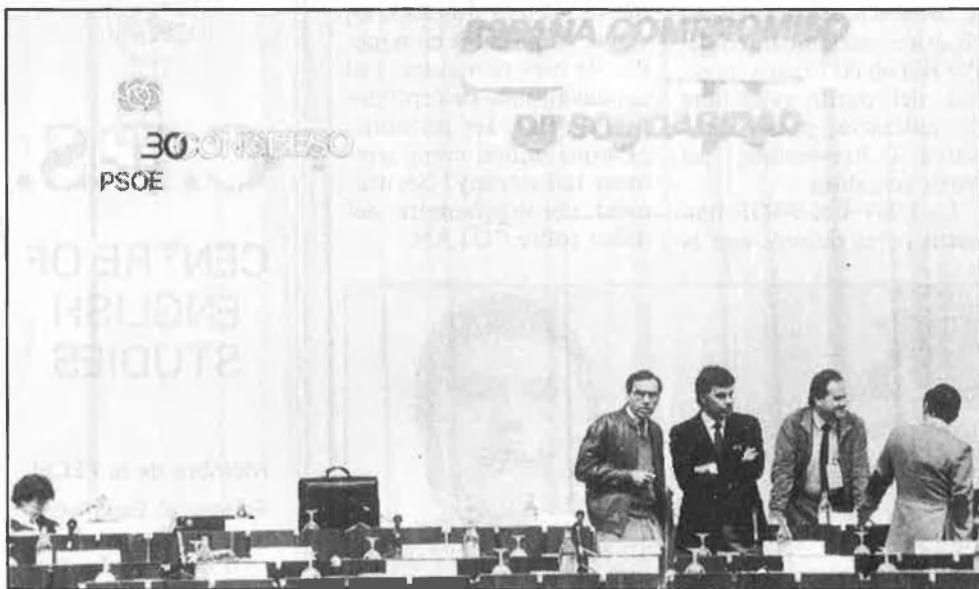
Al XXX Congrés ja s'insinuaren algunes de les divergències