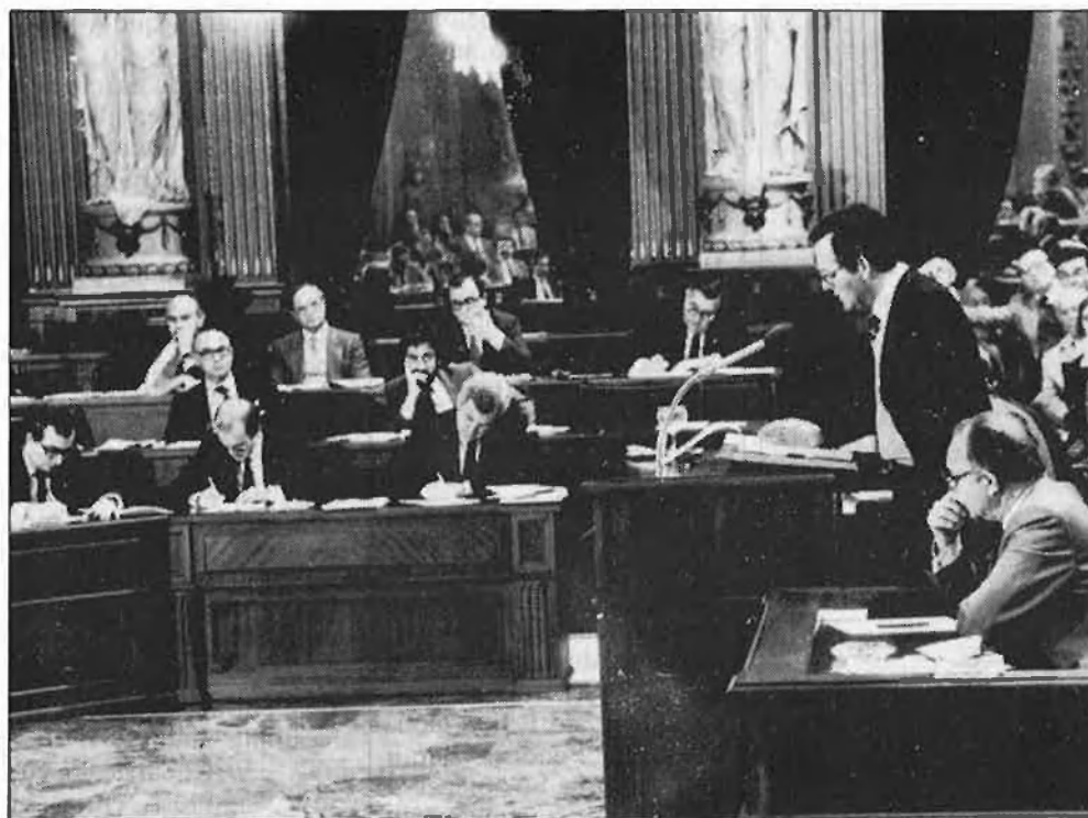
Una sessió del Parlament de les Illes