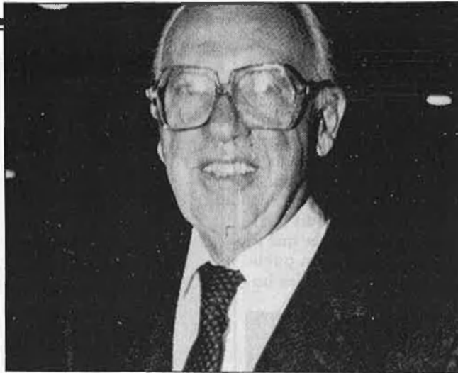
William Casey, l'home fort de Reagan, contra l'«amença marxista»

Malgrat que tant la primera com la segona informació són rigorosament autèntiques, no n'ha aparegut ni mitja ratlla en la nostra premsa. Dos en són, al meu entendre, els motius principals. El primer, que la reforma encara no ha arribat a les agències de premsa espanyoles. El segon, la sorprenent manca de professionals de vàlua que pateix quasi tot l'àmbit perifèric de l'estat, en particular de Catalunya. Hi ha, per exemple, directors que fan tota la impressió de ser càrrecs purament polítics, i fins i tot religiosos. En alguns casos, inclús es tracta de