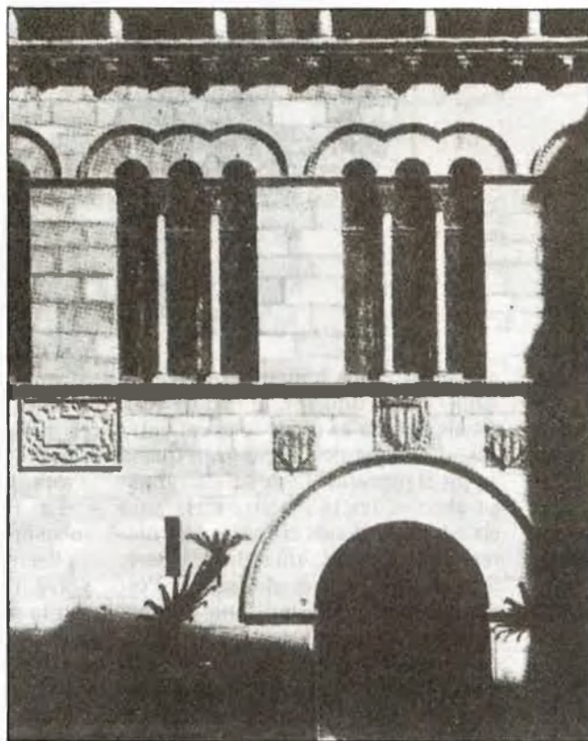
Palau de Llerda on Vicent Garcia recitava una «oració panegírica»