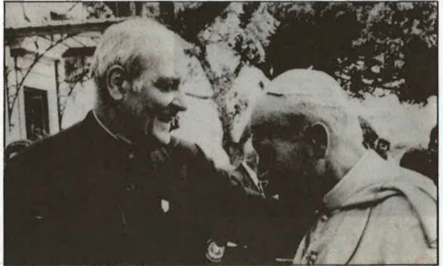
L'arquebisbe Paul Marcinkus, secretari del banc Vaticà

lacionada amb l'IOR (Istituto per le Opere di Religione) vaticà, ingressava en presó, acusat d'haver exportat a l'estranger de manera il·legal centenars de milions de pessetes. L'escàndol esguità l'església, i tornà a actualitzar un tema que, durant anys, havia quedat en una discreta fosca: les finances de l'estat de la Ciutat del Vaticà.