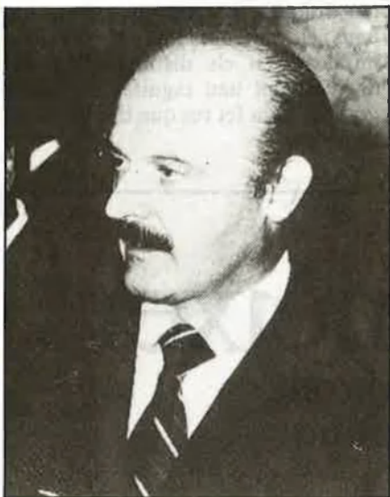
Roberto Calvi, dirigent del banc Ambrosià

El mateix dia de la detenció del «banquer de Déu» (nom amb el qual Calvi era conegut), un altre fet causaria encara més impacte: la publicació de la llista de 962 presumptes membres de la lògia Propaganda-due, que encapçalava Licio Gelli. Calvi era el banquer més important