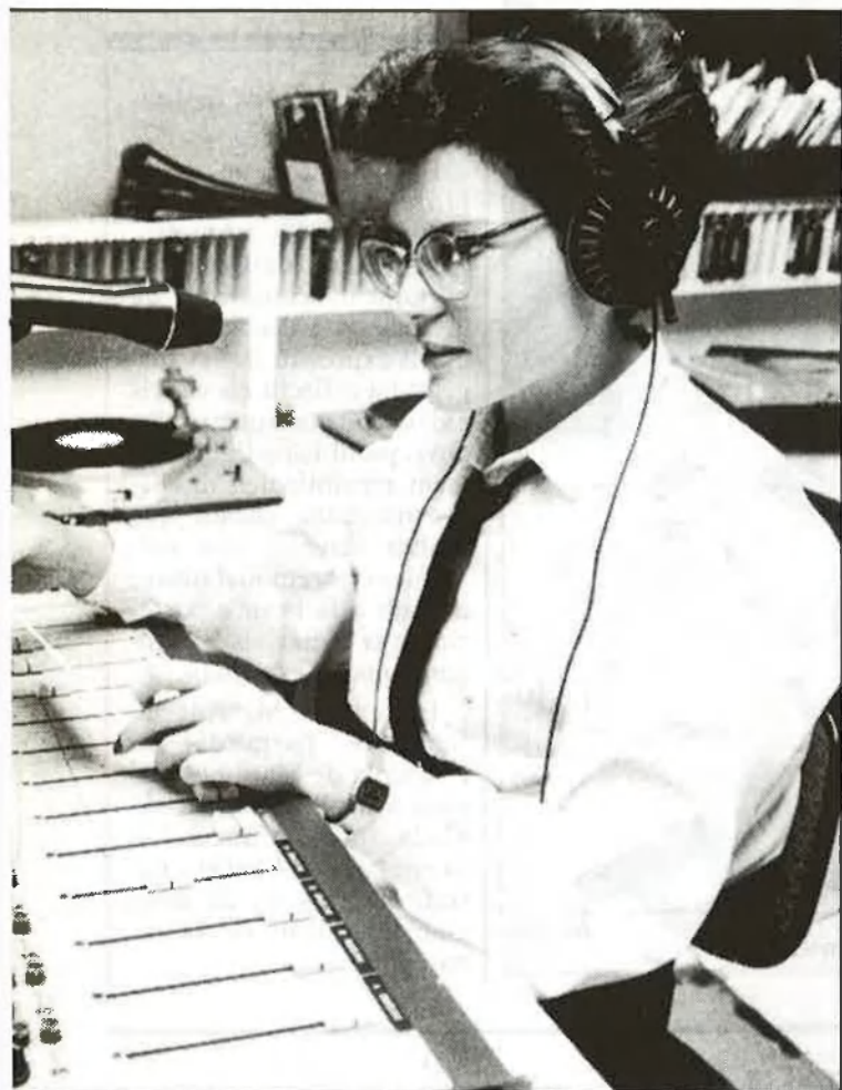
/ Jordi Vicent

tadora, ¡clar! He presentat desfilades de moda a tot Espanya. Crec que els únics llocs que em falten són Guadalajara i Palència... Fins i tot, en una església, com quan vaig haver de fer el pregó de la Setmana Santa marinera, i