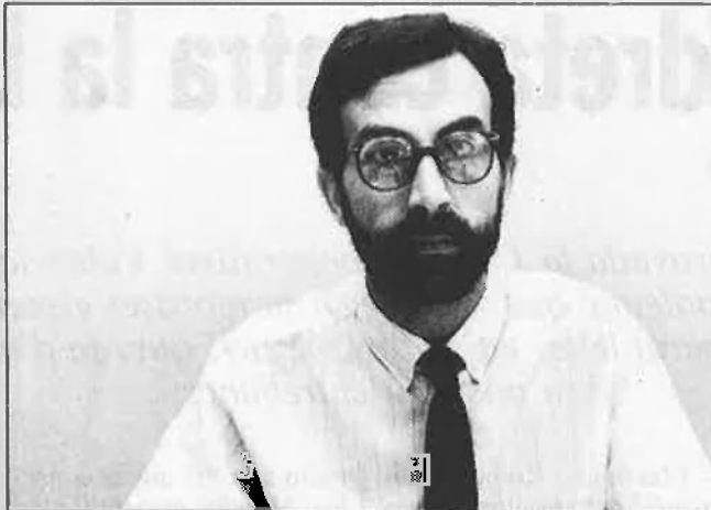
/ Jordi Vicent

«D'altra banda, el projecte no aporta les millors solucions en diversos aspectes i, en altres, introdueix normatives que poden crear problemes al cooperativisme valencià.