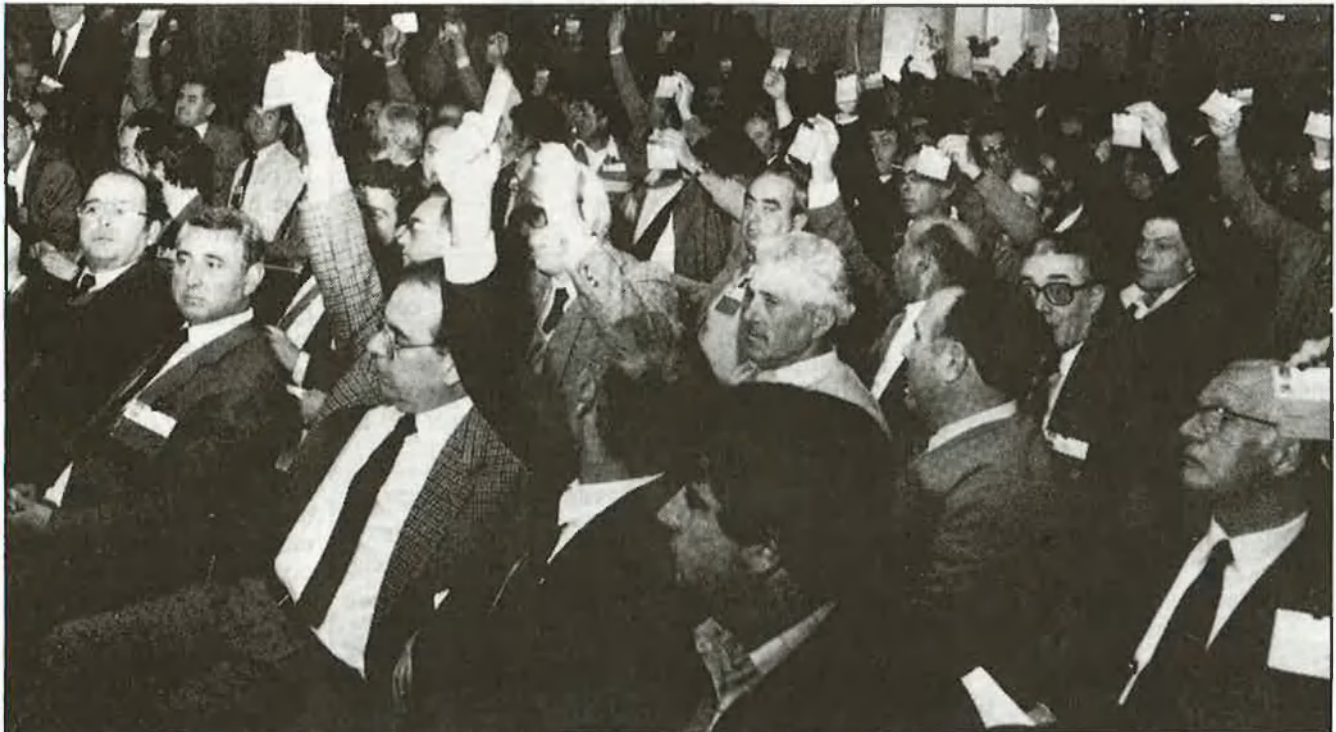
Primer Congrés de Cooperativisme Agrari

Verificacions de comptes, representativitat dels assalariats en els òrgans rectors de les cooperatives,