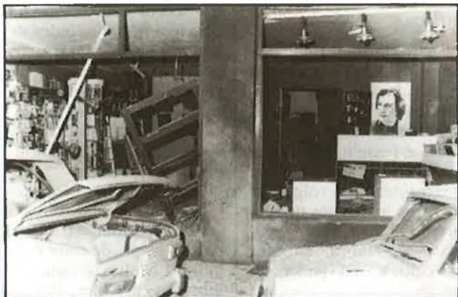
Atemptat contra la llibreria La Costera