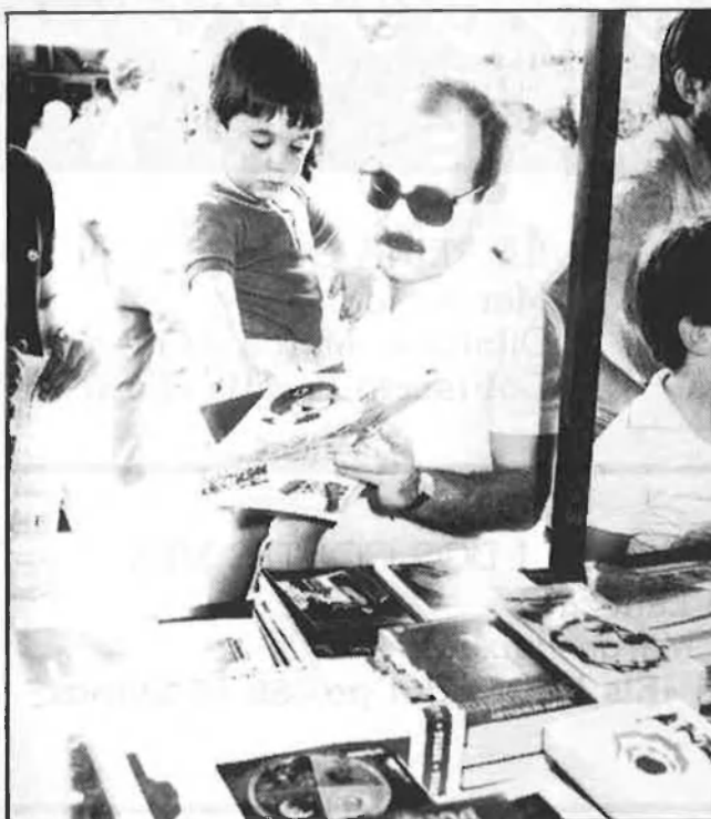
A València del 24 de maig al 2 de juny

brers han remarcat a EL TEMPS la voluntat de conferir un esperit lúdic i festiu a aquesta convocatòria cultural. Músics ambulants, mim, happening i animació, contribuiran a convertir els jardins en una festa.