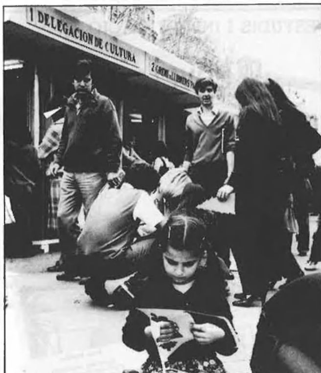
l. a Alacant, del 31 de maig al 9 de juny