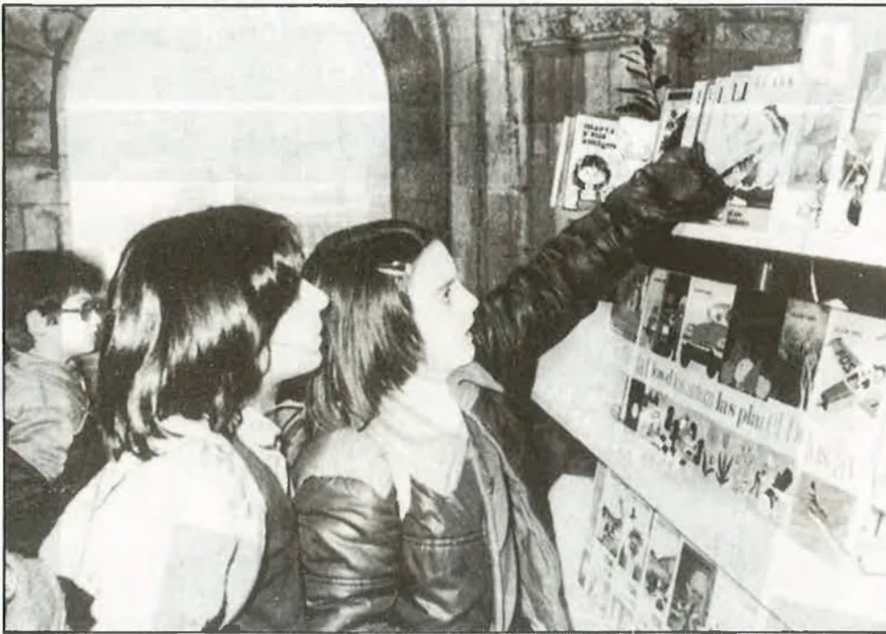
Fires a Castelló, València i Alacant