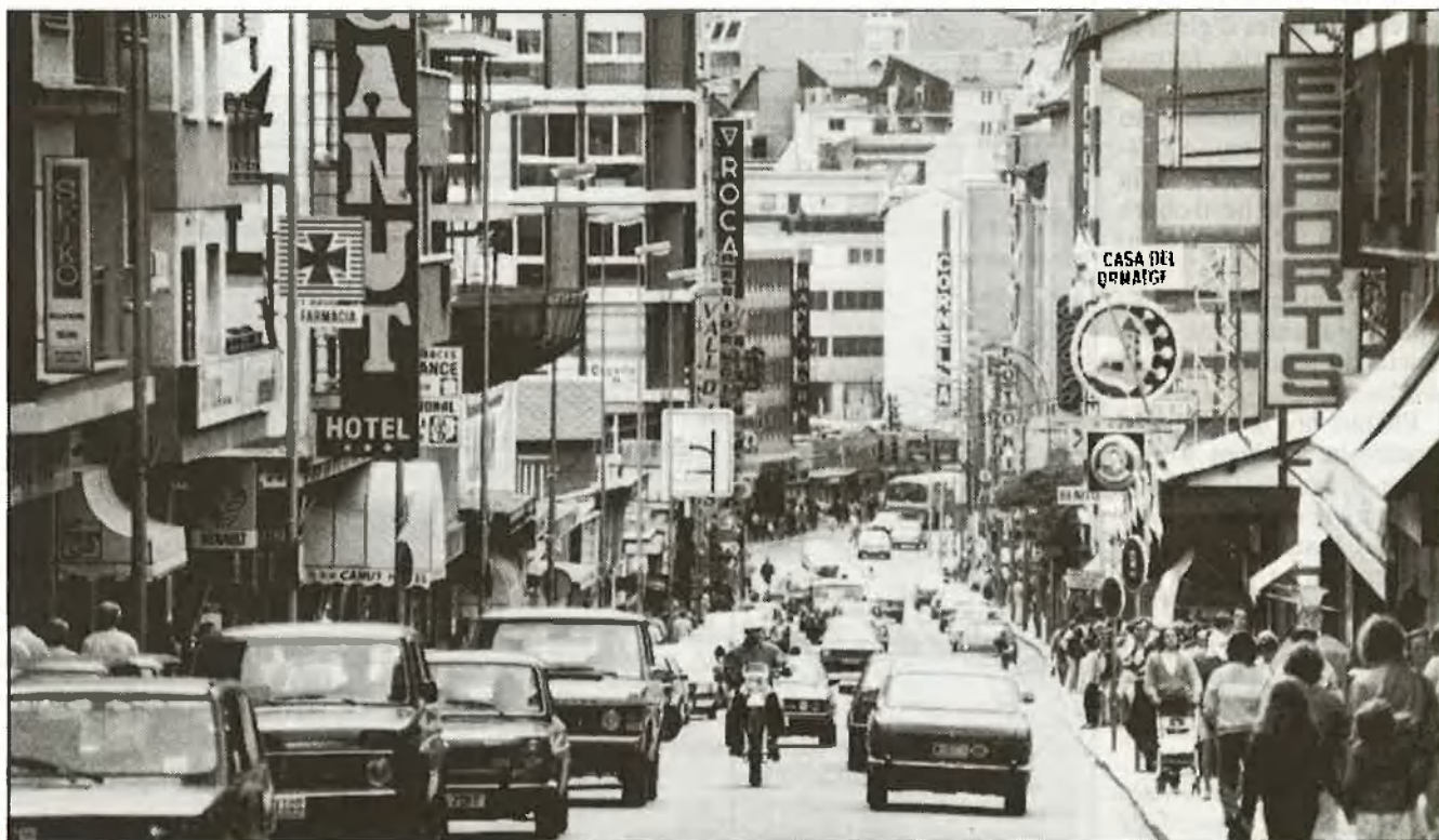
Andorra: ¿un país o una societat anònima?

«afrancesades» pagant la TEC i poden entrar a Andorra, amb el pagament previ de la corresponent taxa a l'Estat andorrà. Aquesta TEC que beneficia França és pràctica contrària al dret comunitari. Cal saber que el volum de l'exportació francesa cap