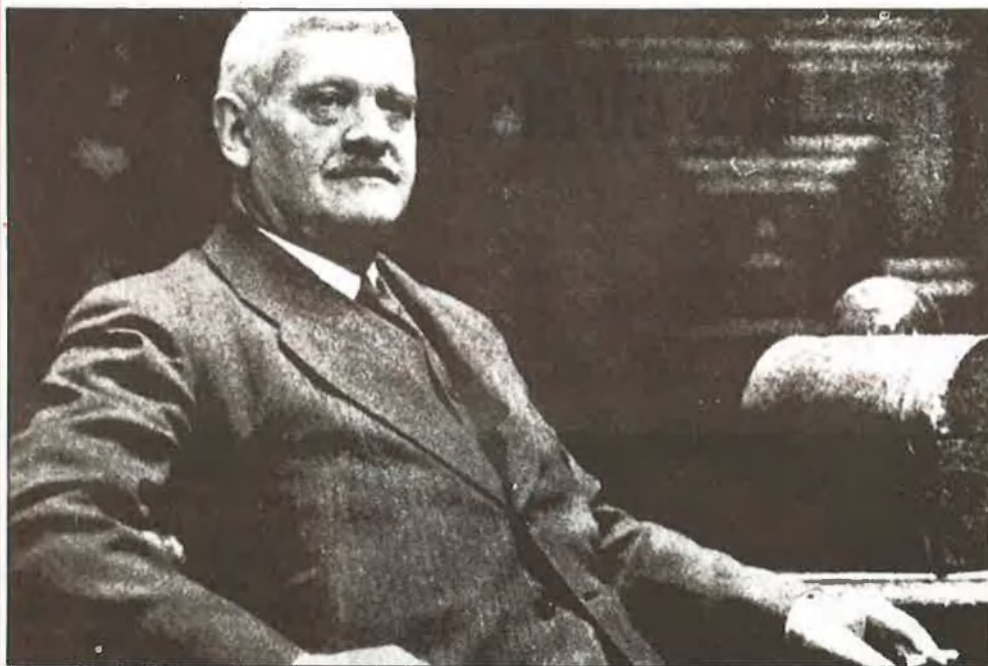
Jaume Carner, ministre d'Hisenda, assenyala el perill que March suposava per a la República