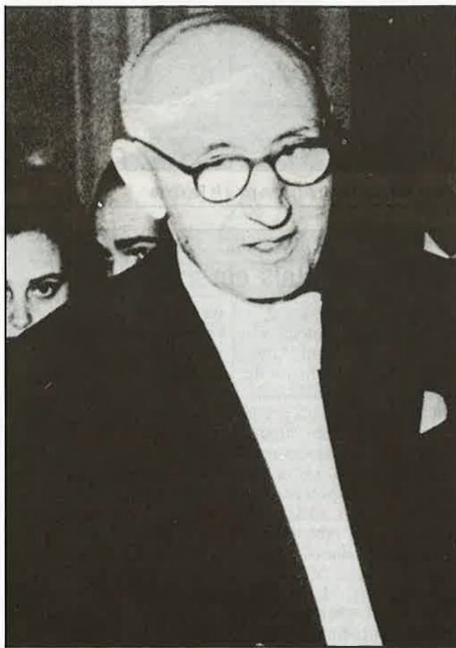
March revestia el seu origen amb certa elegància

March és un misteri i una llegenda, s'han escrit set llibres directament dedicats a la seva persona, però encara resta per reconstruir què féu i com s'ho va fer, per passar de ser un pagès a l'home més