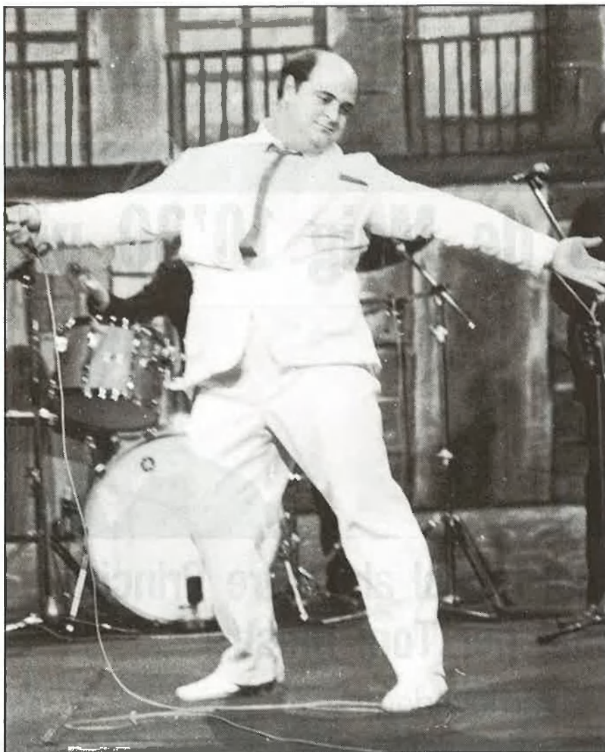
«Si yo fuera presidente» l'ha fet molt popular