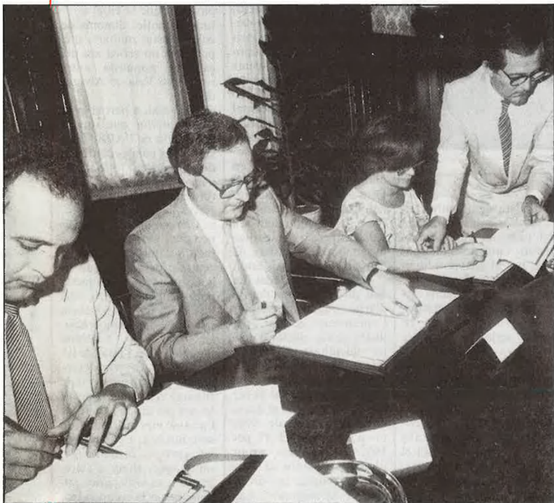
Firma del conveni de reconversió de la fàbrica de gas a València

La relació entre Lebon i Campo estigué plena de conflictes i plets, i de fet, desfeta en 1848 l'associació inicial, es convertí en una lluita oberta de com-