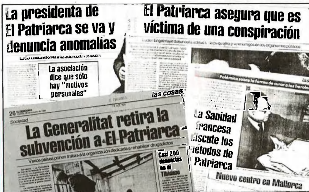
«El Periódico» denuncià els fets

com ara tenir un sol bany i un wàter per a trenta persones. Persones que, se suposa, han d'eixir del mono .