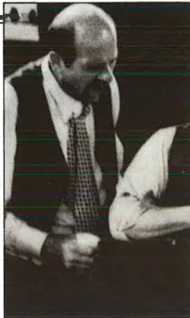
La colla d'amigassos de Primera Plana

disme torna a aparèixer en altres títols amb un punt de vista crític i distanciat. Així, Wilder realitzà un magistral retrat en El Gran Carnaval del desaprensiu i «groc» Chuck Tatum, interpretat per Kirk Douglas, que utilitza l'accident d'un indi en una cova per a realitzar un sinistre muntatge capaç de subministrar-li prou carnada periodística. També Alexander Mackendrick, amb l'ajuda del seu guionista Ernest Lehman i del dramaturg Clifford Odets, que retocà alguns diàlegs, presentà en