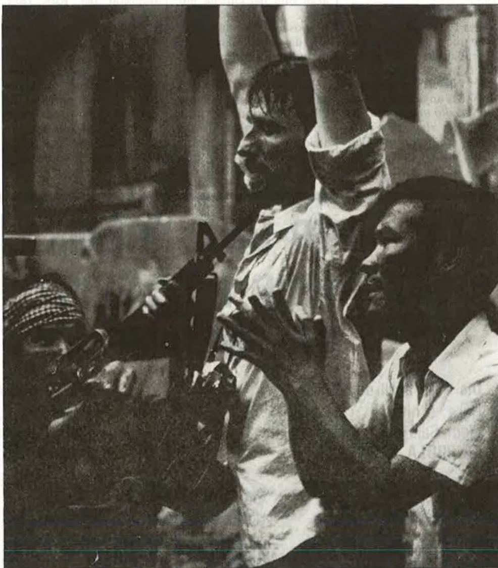
Els dos periodistes de Los gritos del silencio

Es sol citar com un dels primers exemplars de film amb periodistes la nord-americana The Star report , dirigida en 1921 per Duke Worne. Però l'any de gràcia per al subgènere fou 1928. Concretament, el 14 d'agost d'aquest any s'estrenava al Times Square Theatre de Nova York l'obra teatral The Front Page , coescrita per Ben Hecht i Charles Mac Arthur. Aquesta peça teatral donà ocasió a la realització