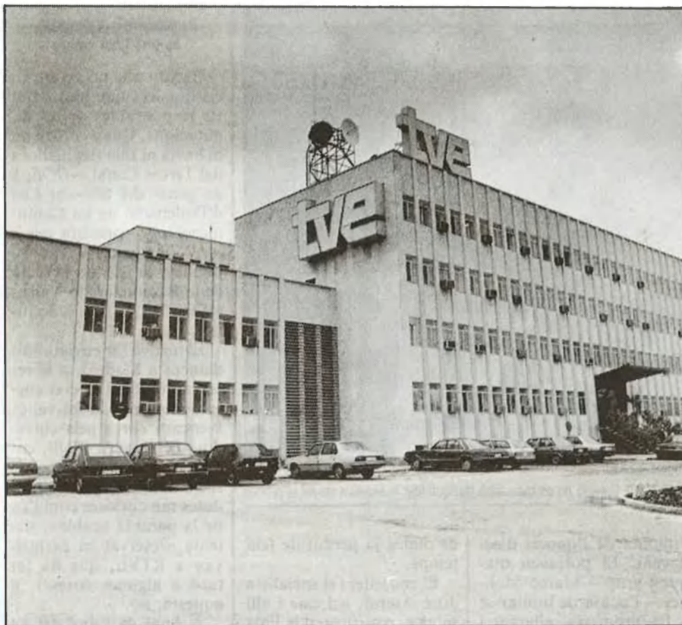
RTVE comptarà amb diners previstos per a RTVV