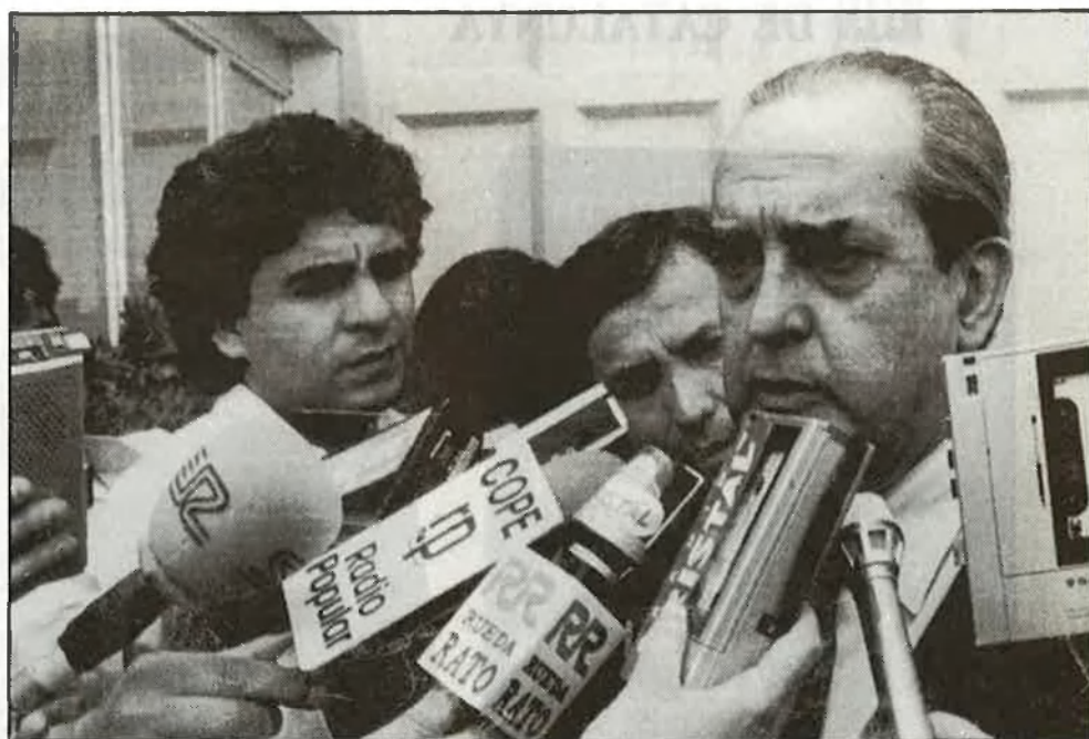
Les negociacions han despertat una gran expectativa.

L'Estat espanyol està negociant l'entrada a allò que s'anomena Comunitats Europees , que són la