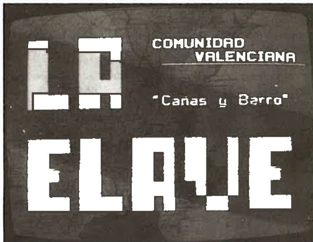
La visió folklòrica de Calvino i Balbín.

Però, malgrat arribar la darrera i acabar de les primeres, hi ha qui ja està buscant el moro en la costa i escriu vertaderes perles literàries, com aquestes del modern Moncho Alpuente, en el seu article «Madrid resucita»: «...plouen els dards sobre la seua autonomia, una autonomia que ningú no ha demanat». I continua: «és indubtable que Madrid no pot oferir una unitat racial, un idioma exclusiu o