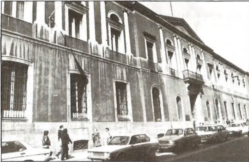
Madrid, autonomia «uniprovincial».