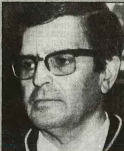
«Encara ens trobem en el costat ascendent de la droga»

R.- Més que les xifres, alarmen els rumors.