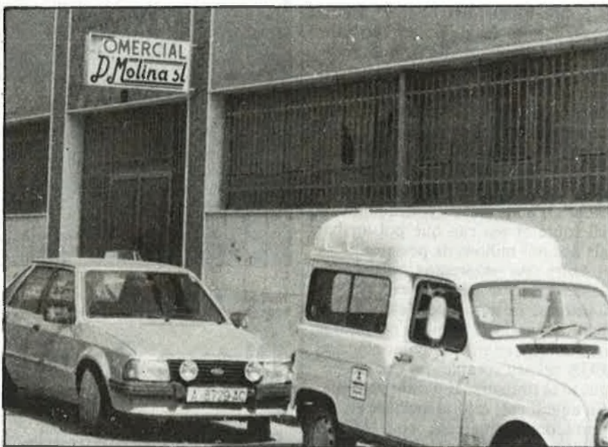
La fàbrica de Molina Chacón a Elx

balladors, que no acaben de fer-se a la idea que els governs de la Gran Bretanya, Suïssa i els Estats Units hagen posat el seu patró davant la cort novaiorquina de Brooklyn, com si es tractàs d'una pel·lícula de l'estil Made in USA.