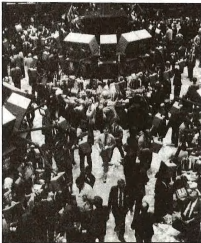
L'alarma ja s'ha escampat en els ambients financers

O, dit d'una altra manera, i en paraules de P. A. Samuelson —Premi Nobel d'Economia—, «la bella dormient europea ha sentit el bes vivificant del príncep nord-americà». Fet i fet, el dèficit pressupostari esdevingué una locomotora que va endur-se darrere la major part del món occidental, inclosa la conca del Pacífic.