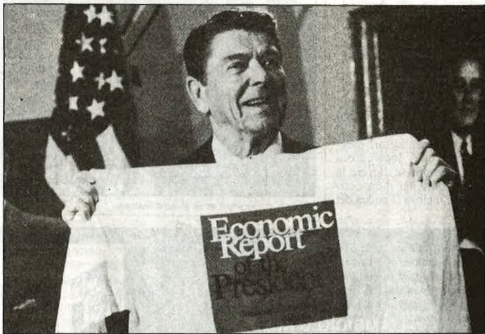
La política econòmica de Reagan es situa al fons del problema

En efecte, segons les darreres dades disponibles, extretes del Bulletí del FMI, el PNB real creixia a una taxa anual del 5'6%, els preus a només un 4'1% i la desocupació laboral es situava en un 7'2% de la població activa, un punt