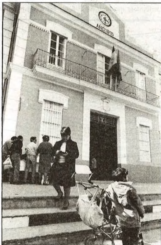
/ Carles Francesc

Ha estat la profunda divisió dins del grup municipal socialista, que ostenta la majoria absoluta, la que ha propiciat i ha forçat la diligent actuació de bombardeig econòmic del Consell. Cinc regidors d'Esquerra Socialista van votar en contra la proposta de López per tal d'aconseguir diners a través d'un crèdit de Banco Hispano Americano. Aquests mateixos edils han denunciat l'alcalde davant de la comissió de conflictes del PSPV-PSOE, per una presumpta falsificació de l'acta de l'assemblea local, on, en família, es va acordar demanar crèdits. Potser, aquesta volta, els denunciants tindran més sort.