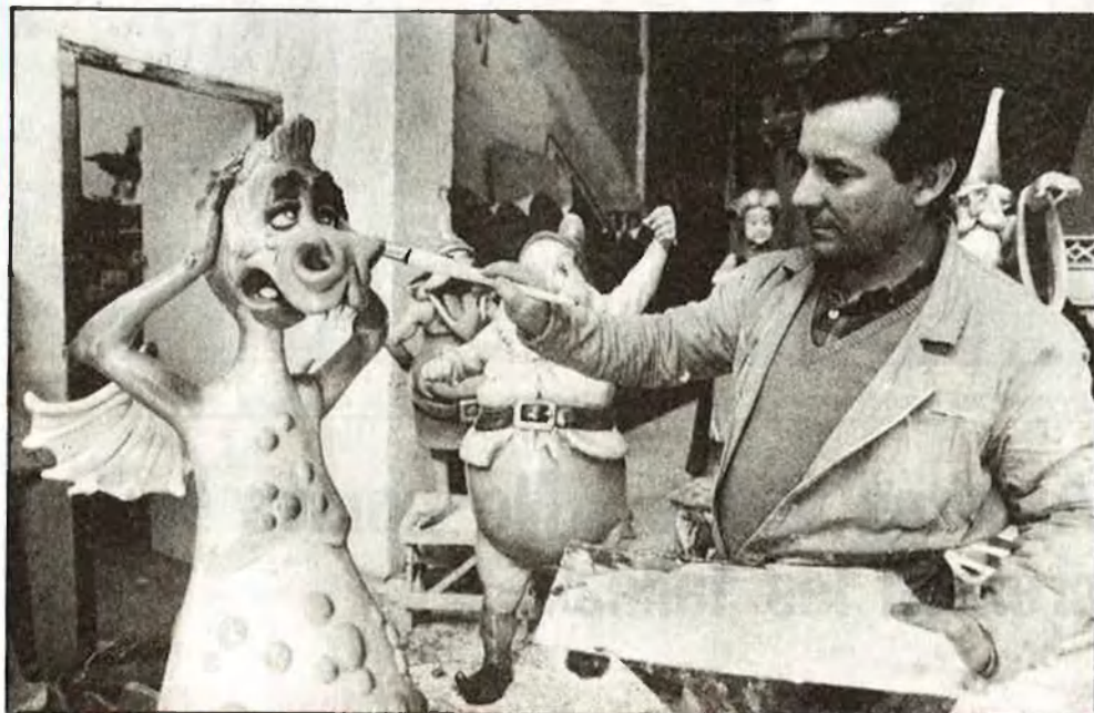
«El funcionament de l'artista faller avui és tercermundista»

P.-¿Pot arribar la comissió a censurar una idea de l'artista?