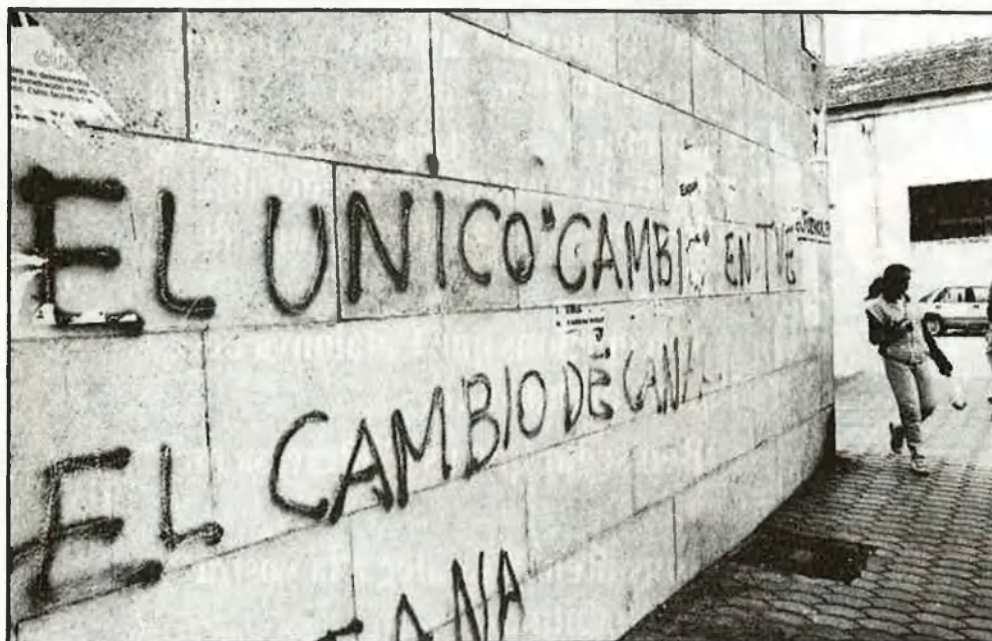
Velles pintades que ara prenen actualitat