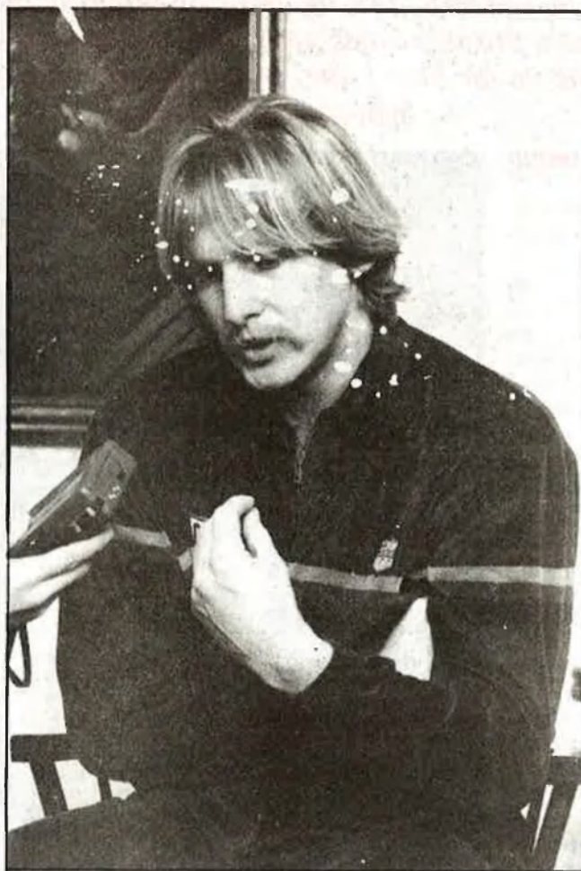
Tímid i, tanmateix, terrible