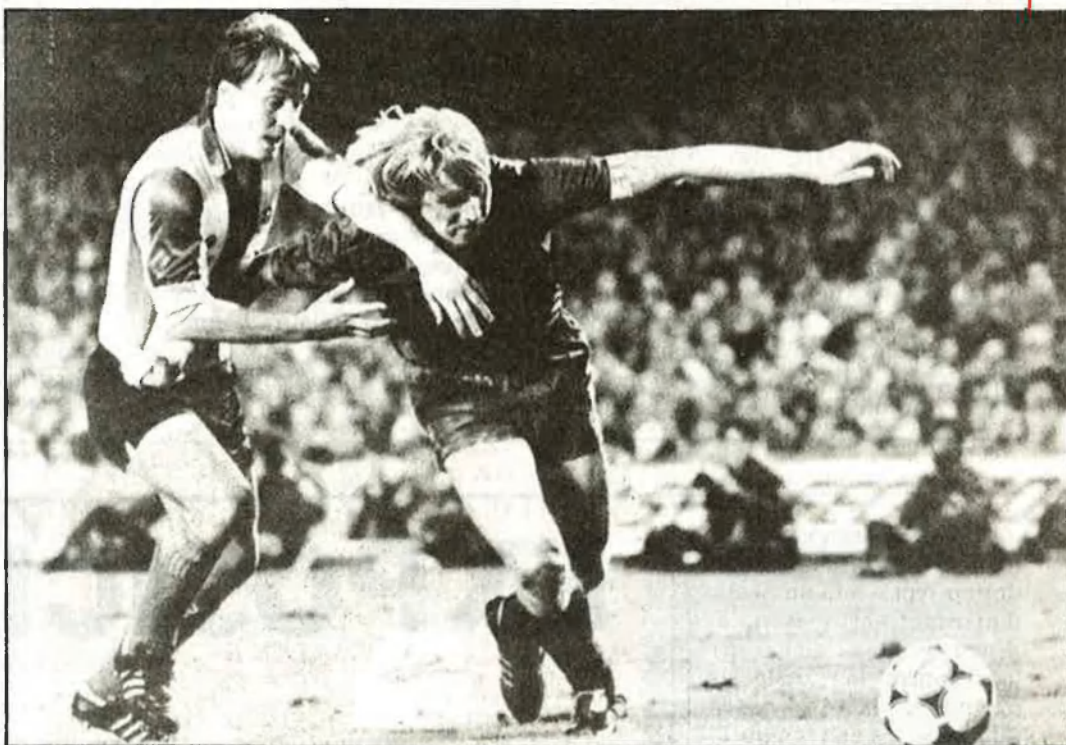
Estem preparats per a representar Catalunya a Europa

R.- Sí, segur. Nosaltres tenim experiència en les competicions internacionals. Estic molt il·lusionat en la copa d'Europa del proper any.