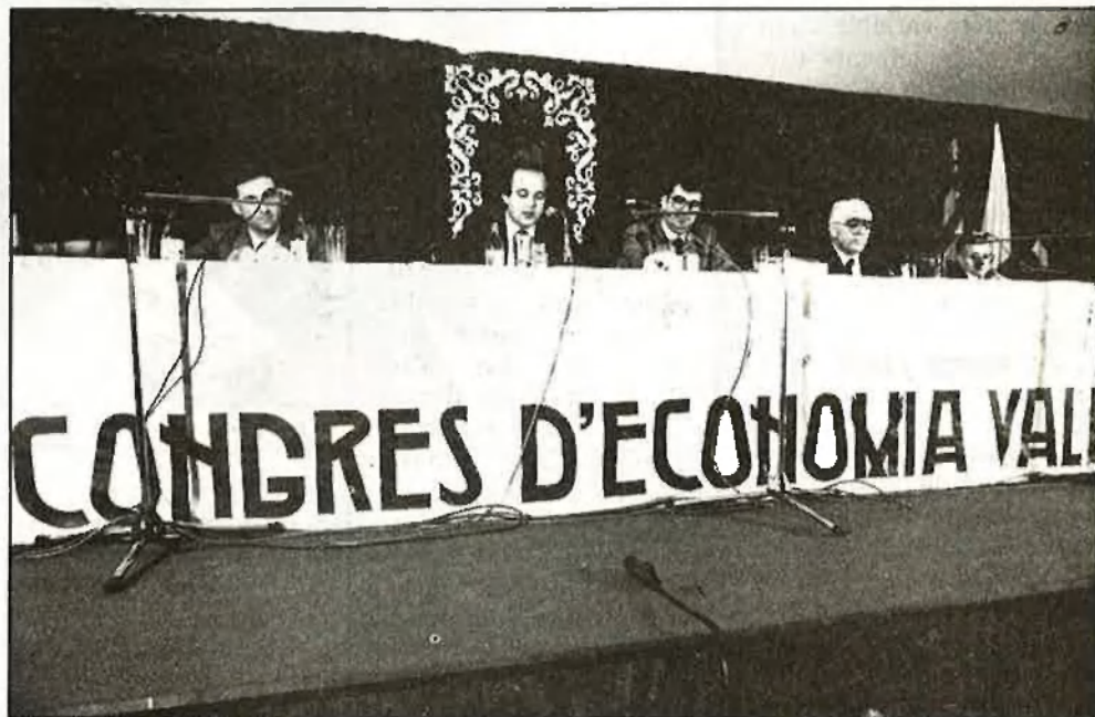
I Congrés d'Economia Valenciana, una iniciativa amb algunes dosis d'espontaneïtat

La Facultat de Ciències Econòmiques i Empresariales de València, i recentment la d'Alacant, tenen una gran responsabilitat en l'explicació d'aquest fenomen positiu per a la societat valenciana. En efecte, la introducció de diverses matèries relacionades amb la nostra realitat immediata, en distintes disciplines, és un fet de fa alguns anys, com també ho és l'interès recent de professors i alumnes en l'estu-