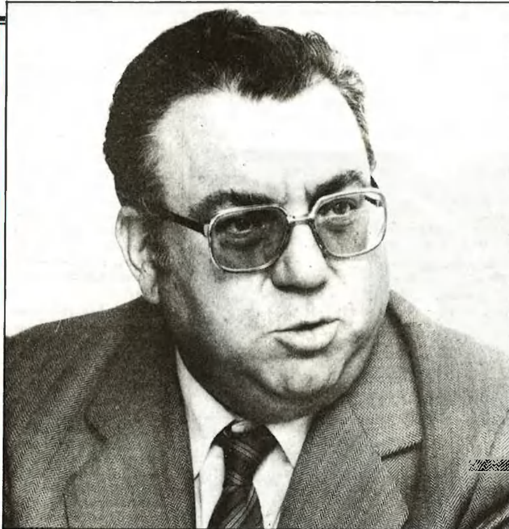
Monsonís creu que tornarà a ser president de la Generalitat