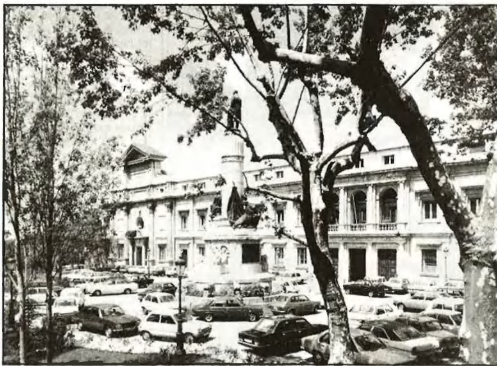
Edifici del Senat, la cambra de les autonomies